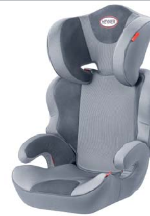
MaxiProtect ERGO SP