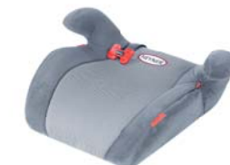
SafeUp M ERGO

In unterschiedlichen Farben erhältlich. In different colors available. Имеется в продаже разного цвета.