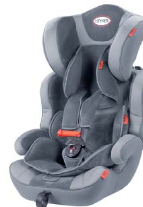
MultiProtect ERGO SP