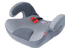
SafeUp L ERGO