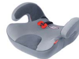
SafeUp L ERGO