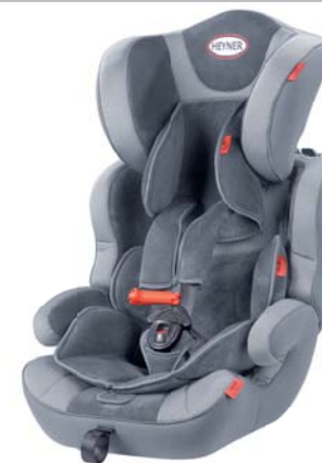
MultiProtect ERGO SP